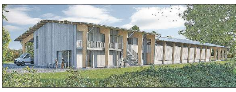
Links jubeln Gärtner und Baufachleute am Spatenstich für das neue «Bildungszentrum Gärtner» von «JardinSuisse Aargau», wie es sich rechts in der Visualisierung vom Büro Walker Architekten AG, Brugg, zeigt.